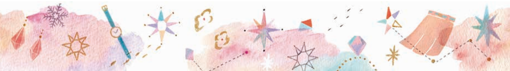
Photo Gen Hiraga Text Nao Morinaka Stylist Masato Konishi Illustration narumio3

※価格、商品のデザイン・仕様は変更になる場合があります。 ※商品は数に限りがありますので、売り切れの際はご了承ください。 ※バゲージ開催期間などは店舗により異なる場合があります。 詳しくは店舗にお問い合わせください。 ※価格は消費税を含まない、本体のみの価格です。