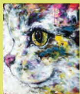
山内亮「有り体に言って」 (キャンバス、油彩、 45.5×38cm)

DATA 「第23回時代の道具市」 開催場所: 8階催場 開催日時: 2018年12月26日(水) から30日(日) (最終日は～ 16:00)