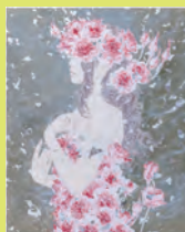
平田望「Rose Mystica」 (日本画、30号)