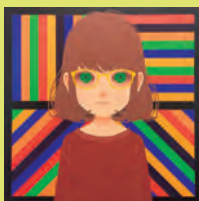
山田航平「レス イズ ポア」 (パネルに綿布、油彩、 53×53cm)