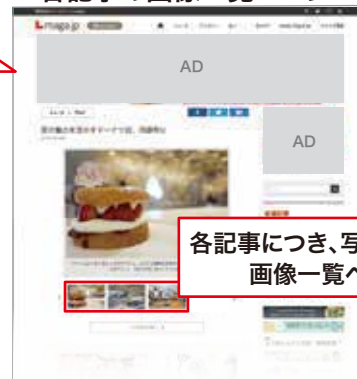
写真一覧ページの構成要素