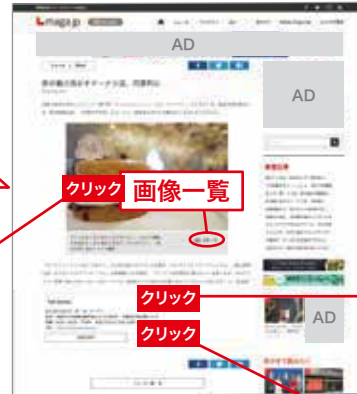
ページの構成要素