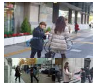
※街頭配布イメージ