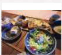
#しずる感たっぷり

今回の旅のルールは、撮影した写真を「#なら女子旅」のハッシュタグを付けてInstagramにアップすること。Instagram上には、参加者が思い思いに撮影したならの風景が並びました。その中の一部をピックアップしてご紹介！