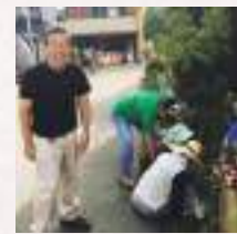
# 陽気な案山子めぐり実行委員長