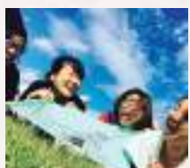
#とっても楽しそう