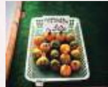
# かぼちゃを雑貨みたいに

ほかにもまだまだたくさん! すべての作品は http://lmaga.jp/nara_camera/ でチェックしてみて!