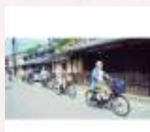
#人を入れることで動きが出るね