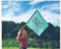
# フラッグを良い小道具として