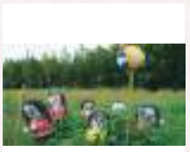
# かかしオリンピック開催中