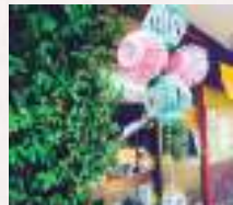
#缶缶アートがビビッド