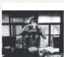
#モノクロが良い雰囲気