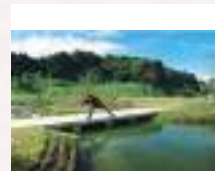
# 青空の下でヨガポーズ