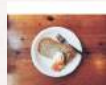
# イチジクシフォンをかわいく