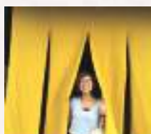
#のれんを画面いっぱい