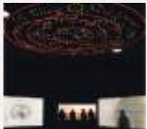
#四神の館の内部は幻想的