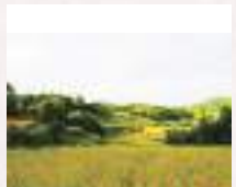
# 一面黄金色の棚田