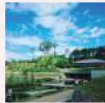
# 青と緑のナイスコントラスト