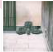
#なら女子旅 #瓦の神様