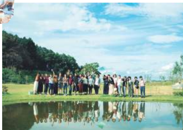
抜けるような青空をバックに参加者&コーダ先生、みんなで記念撮影。池が鏡面のようにかっこいい写真に。

前日までの雨の予報を吹き飛ばすように、お昼を過ぎると見事な快晴に。ここはキトラ古墳壁画体験館 四神の館がある国営飛鳥歴史公園。緑いっぱいの気持ちの良い場所でした。