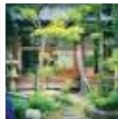
#なら女子旅 #懐かしい縁側