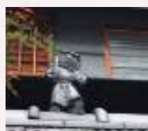
#知らなかった発見