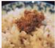
#おかずみそにズーム