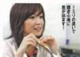
「すべてに徹底的にこだわりました」と本企画のリーダー的存在、ベネビスの運営者さん。