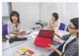
上の色が通常使われている靴箱。こんなに変わった真っ赤な靴箱はベネビスでは初めてです。