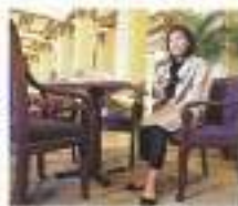
ホテルでもこれならスマート。