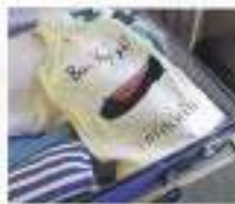
トランクの中でもおたくら収納。