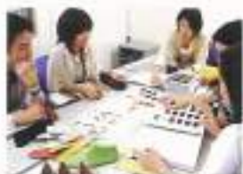
足が疲れにくくて、革靴でも長く歩きたいのがいい!木型もイチから特別に制作。