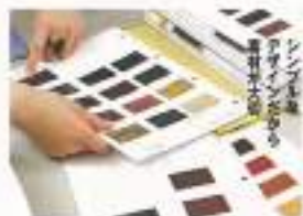
出ま上がり想像しながら膨大なサンプルから、型押し、エナメルを2層重ねセレクト。