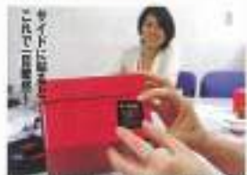
収納の際、靴にこのシールを貼れば中にパレエシューズが入っているのが分かるよ!