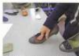
夏は暑い中の中敷きは高性能の抗菌・防臭効果素材を採用。やわらかいソールもポイント。