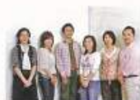
今回のメンバー。中央の男性、中央さんは上級シューフィッターの資格を持つ靴のプロ。