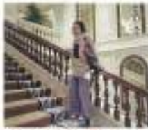
カジュアルでも小粋な履きだし!