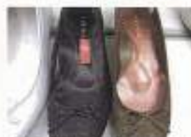
透めのカット、リボン地の緩取り、真っ赤な中敷きなど、サヴィからデザインは熱く、要望!