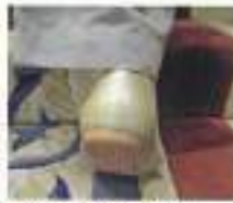
前後の上りもかかとがフィット。