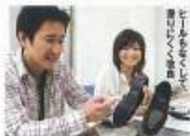
サヴィからのオーダーはシューフィッター没が?! 何度も改良を重ねてもらいました。