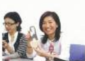
「このハイヒールが、足裏に伝って気持ちいい!」と本誌編集長!調はファッション担当M.