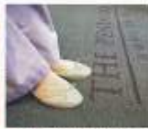
編組、平場の足でもスリキリ。