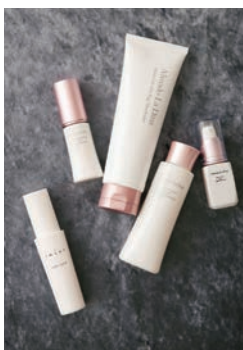
アルマード ラディーナ ● http://www.la-dina.com imini ● http://www.imini.jp