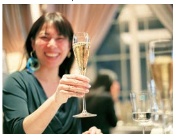
美しく盛られた料理にご満悦の様子。「どのお皿もほど良いポーションで、品数豊富なのがうれしいです!」

高校時代の親友と参加し、なんと抽選会では共に卵殻膜コスメが当たったラッキーなお二人。