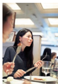
セミナーが終わってからの食事でも、皆さんはインナーとコスメの話題で盛り上がっていました。